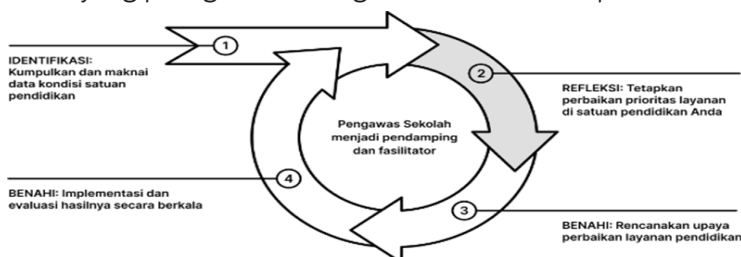
Gambar 1. Siklus Perencanaan Berbasis Data

Dalam menetapkan prioritas pembenahan harus mampu menganalisa data dengan baik, kepala satuan pendidikan dan pemangku kepentingan yang relevan harus dapat berdiskusi dengan menggunakan pertanyaan pemantik sebagai berikut: (1) Mana indikator yang memiliki dampak paling besar kepada peserta didik? (2) Dengan mempertimbangkan sumber daya yang tersedia, berapa banyak indikator yang bisa menjadi fokus sasaran perubahan? (3) Mana indikator prioritas yang belum baik dan membutuhkan perubahan segera? (4) Mana indikator yang paling sesuai dengan visi misi satuan pendidikan?